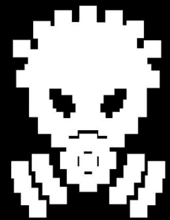
DJ K-TALYTIK DJ

Kréature Krachs Tests KritiKs K-Terpilar